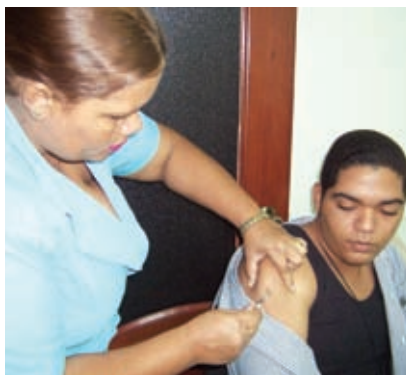
Vacunación a empleados de la Digecog

Assumiendo la puesta en marcha del plan estratégico de la Digecog para el año 2008, el departamento de Recursos Humanos ha encaminado sus labores a efficientizar la calidad de su personal, en ese sentido mantiene un programa de capacitación en los diferentes niveles y funciones. Durante los meses de enero y febrero desarrollaron actividades en beneficio del más valioso de los recursos, así como también se capacitaron unos doce empleados en las áreas de alfabetización digital, además diez empleados recibieron el curso de Ética para el Servidor Público. Iniciando las labores del nuevo año, el personal fue objeto de un recibimiento con un acto de salutación acompañado de un brindis de jengibre y picadera lo cual fue gratamente recibido por el personal, en ese mismo orden fue celebrado el día