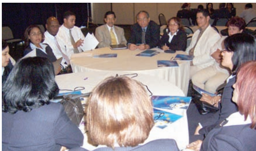
Mesa de trabajo.

dos cada área de trabajo expusieron sus experiencias durante el proceso de cierre fiscal, las cuales se analizaron en grupo y sus recomendaciones y conclusiones serán recogidas en documento final para que constituya una fuente de mejores prácticas. La actividad fue celebrada en el salón La Mancha del Hotel Lina.