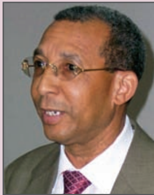
Manuel Monegro Paredes Director General de la Digecog.

Por tercer año consecutivo, la Dirección General de Contabilidad Gubernamental (DIGECOG), preparó y entregó en tiempo oportuno a las instancias que determina la ley, el Estado de Recaudación e Inversión de las Rentas correspondientes al ejercicio fiscal 2007.