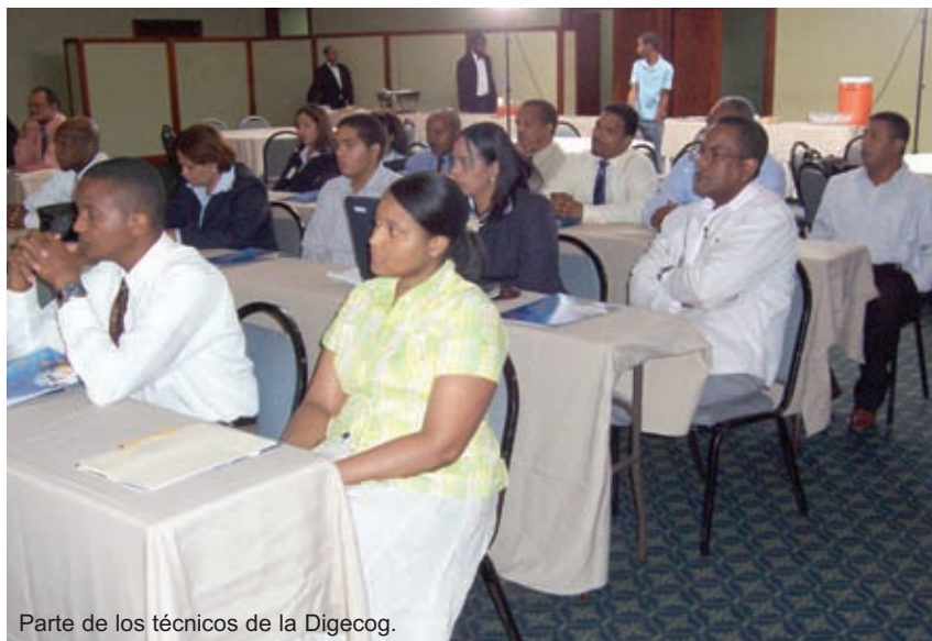
Parte de los técnicos de la Digecog.

Monegro destacó que en el 2007 se realizaron más de 900 mil transacciones económicas en el sector gubernamental, al tiempo que valoró la importancia de ese taller, porque a su juicio la capacitación permanente sirve para