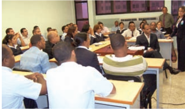
Empleados de la Digecog

Con estos conocimientos, la Digecog podrá medir las cualidades demostradas de cada recurso humano y valorar su fuerza laboral para rea-