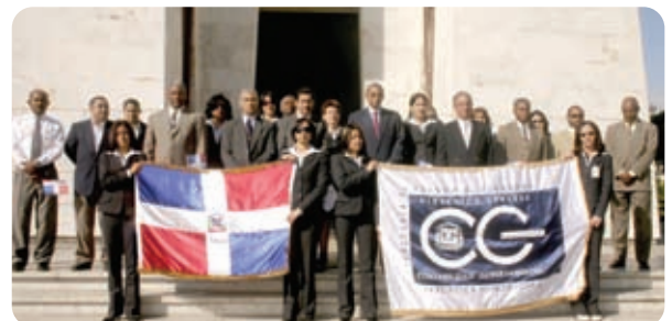
Ofrenda floral en el Altar de la Patria