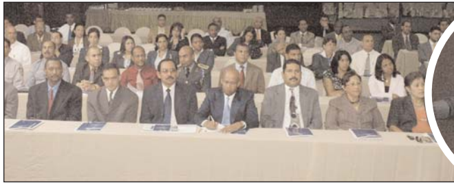
Parte de los asistentes al acto.

La Dirección General de Contabilidad Gubernamental (Digecog), dejó funcionando su nueva página Web, durante un acto celebrado en el salón Fiesta del Hotel Lina, donde asistieron representantes de varias instituciones gubernamentales y los actores responsables del área financiera del gobierno central y descentralizado. En el acto se puso en circulación la segunda edición de la Ley 126-01 que creó la Dirección General de Contabilidad Gubernamental y su Reglamento Orgánico de Aplicación.