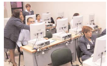
Participantes de la capacitación.