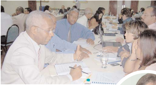
Mesa de trabajo.

P ara asimilar las experiencias dejadas con la elaboración del informe “Estado de Recaudación e Inversión de las Rentas Correspondiente al año 2006, el personal técnico y gerencial de la digecog realizó un taller de trabajo durante dos días en un hotel de la ciudad.