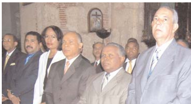
Misa de acción de gracia con motivo de la celebración del 4to. aniversario de la Digecog.

La Dirección General de Contabilidad Gubernamental (Digecog) fue creada mediante la Ley 126-01 de 27 de julio del 2001 y en la misma se establece que tiene por objetivo el registro sistemático de todas las transacciones relativas a la situación económica de los organismos comprendidos en el gobierno central, instituciones descentralizadas, empresas pú-