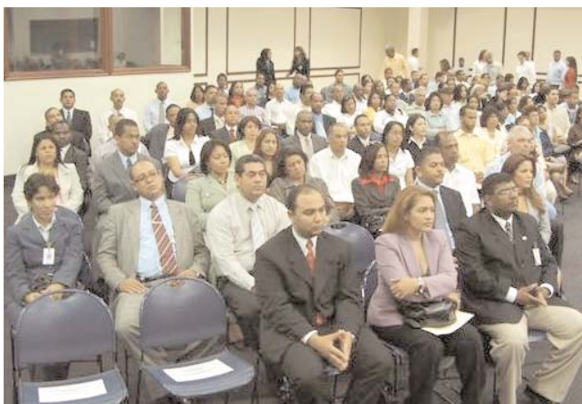
Representantes de instituciones públicas.

Unos 20 empleados (Digecog), fueron incorporados al sistema de carrera administrativa durante la celebración del décimo quinto