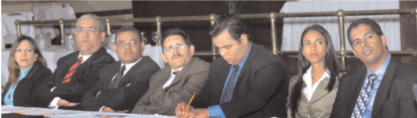
Participantes de otras instituciones

En nuestro país se desempeña como consultor en gestión financiera pública, contratado por el BID y el Gobierno Dominicano.