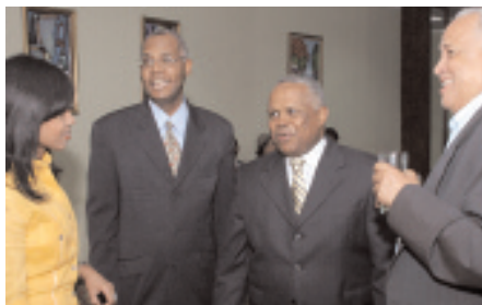
El director conversa con periodistas.

Al poner en circulación la nueva edición del