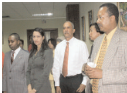
Empleados y periodistas.