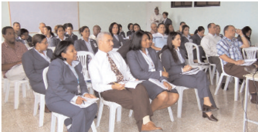
Participantes en el curso sobre Número de Comprobante Fiscal.

Uno de los principales pilares en el que la Digecog procura avanzar hacia el progreso y desarrollo del sistema de contabilidad gubernamental descansa en la capacitación y adiestramiento de sus empleados.