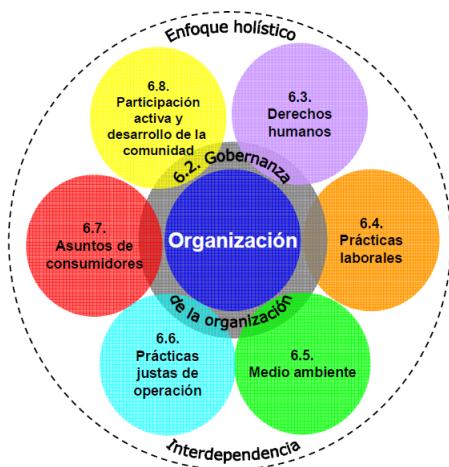
Figura 3 — Las siete materias fundamentales

En el gráfico debajo se puede apreciar la articulación de las 7 materias que cubre la Norma ISO 26000 sobre Responsabilidad Social que coloca en el centro la Gobernanza de la Organización, vinculada con las demás materias, vistas a partir de un enfoque holístico en el cual se hace una representación concatenada.