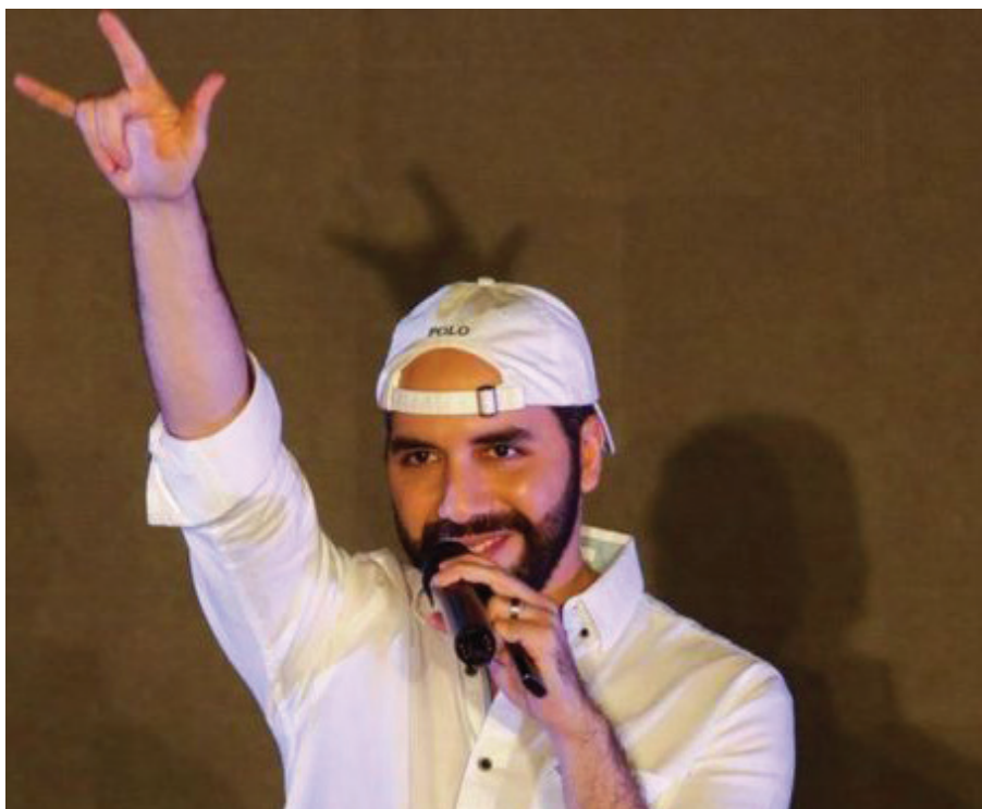
Bukele renunció a su cargo de presidente para hacer campaña electoral con miras a obtener un segundo mandato.

El presidente en licencia de El Salvador, Nayib Bukele, celebró esta semana la subida del precio del bitcoin.