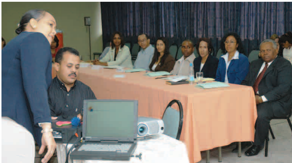
Taller de capacitación para gerentes.

El programa ha sido llevado al personal de la Contraloría, Industria y Comercio, Bienes Na-