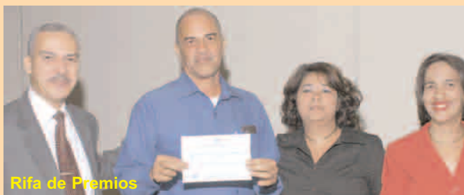
Rifa de Premios