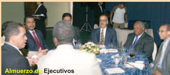
Almuerzo de Ejecutivos