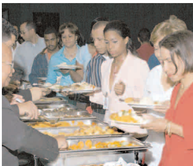
Momentos del Almuerzo