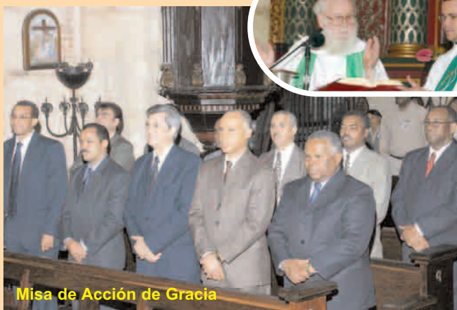
Misa de Acción de Gracia