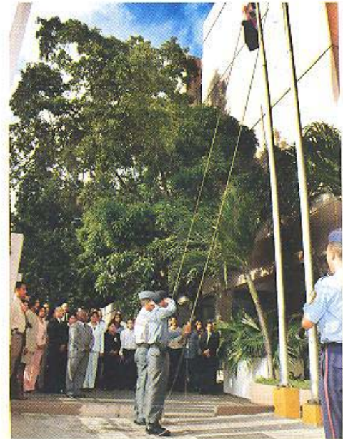
Empleados participan en los actos de izamiento de bandera y la misa en la Iglesia Las Mercedes (Zona Colonial)

Las actividades del Segundo Aniversario concluyeron con un almuerzo entre los empleados de la institución en el cual el Director General al hacer uso de la palabra dijo que: “al celebrar este aniversario lo hacemos llenos de alegría y felicidad, siendo un momento oportuno para reflexionar sobre el compromiso de seguir trabajando en la transparencia de las finanzas públicas”.