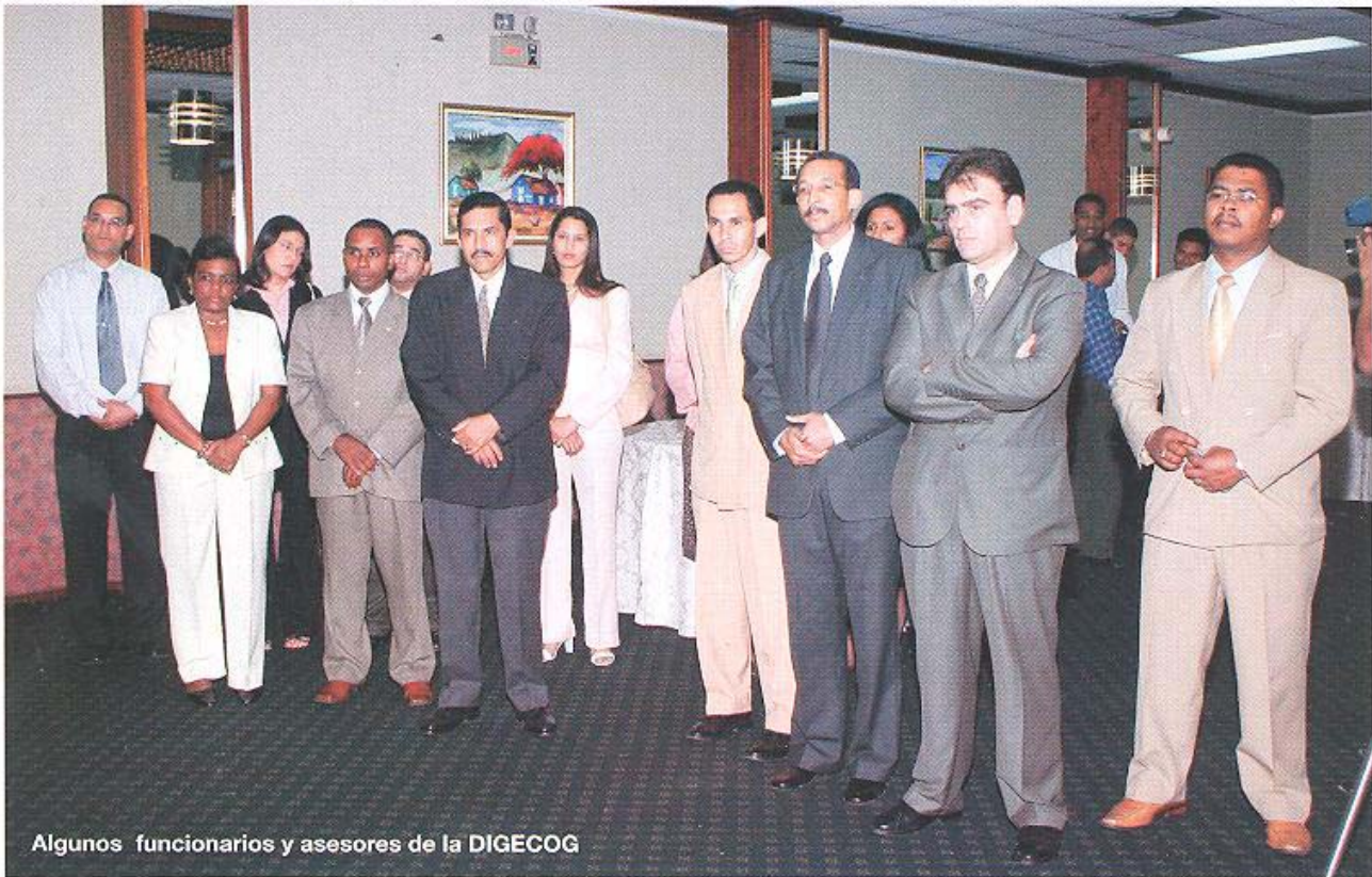
Algunos funcionarios y asesores de la DIGECOG

hizo referencia a otras acciones durante estos meses como es el caso de la realización de talleres para capacitar a los funcionarios del área administrativa y financiera de las instituciones del Gobierno Central, respecto a las experiencias del proceso de Cierre del Presupuesto del Ejercicio Fiscal del año 2004 y las pautas para trabajar con el presupuesto del próximo año.