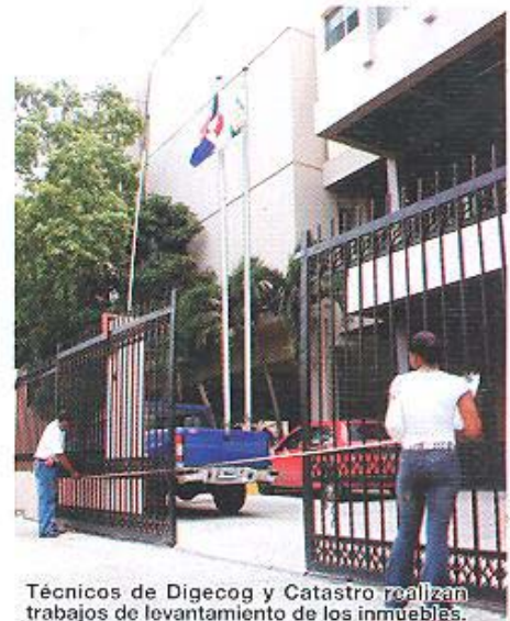
Técnicos de Digecog y Catastro realizan trabajos de levantamiento de los inmuebles.

La Unidad de Valuación de Inmuebles del Estado, informó que en apenas tres meses del inicio de los trabajos, se ha tasado el diez por ciento de los inmuebles pertenecientes a las instituciones públicas.