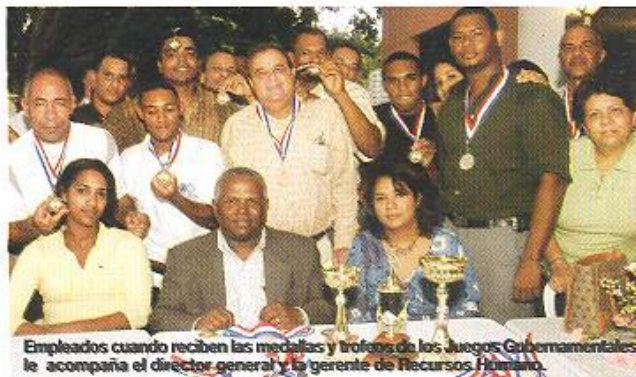
Empleados cuando reciben las medallas y trofeos de los Juegos Gubernamentales le acompaña el director general y la gerente de Recursos Humano.

Las medallas y trofeos fueron entregadas por el Director General y Encargados Departamentales en un encuentro con los empleados celebrado en el Hotel Lina de Santo Domingo en ocasión del Segundo Aniversario.