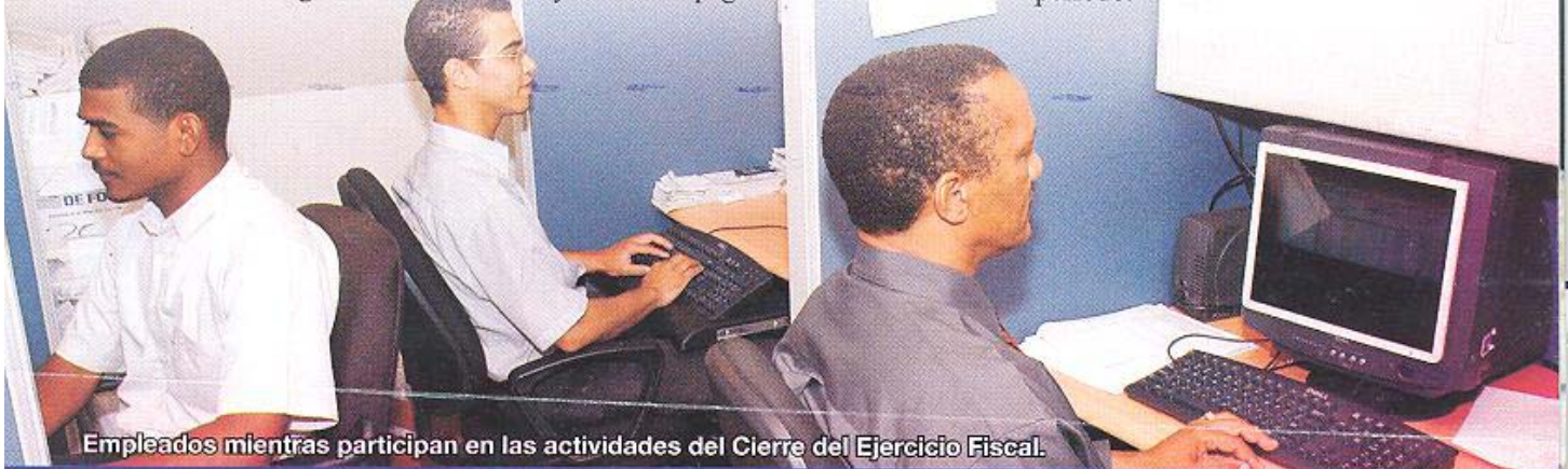
Empleados mientras participan en las actividades del Cierre del Ejercicio Fiscal.

La DIGECOG en su facultad de Órgano Rector de la Contabilidad, es la responsable de velar por el cumplimiento de estas normas y solicitar a las Direcciones Administrativas y Financieras la presentación del informe de cierre del ejercicio de las operaciones del periodo.