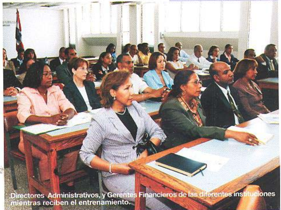
Directores Administrativos, y Gerentes Financieros de las diferentes instituciones mientras reciben el entrenamiento.

Entre los temas tratados en la capacitación figuró: la importancia de la presentación del Informe de Cierre, la información mínima que debe contener el Informe, los Reintegros de Cheques y los Anticipos Financieros (Fondos Reponibles y en Avances).