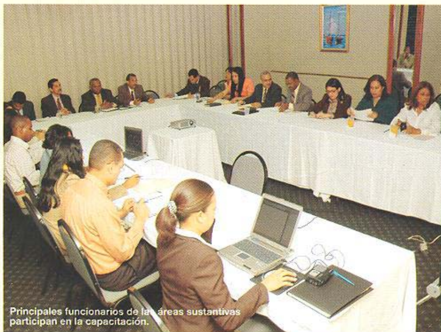
Principales funcionarios de las áreas sustantivas participan en la capacitación.