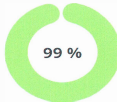
Segundo trimestre 2023