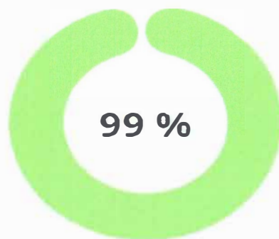
Primer trimestre 2023