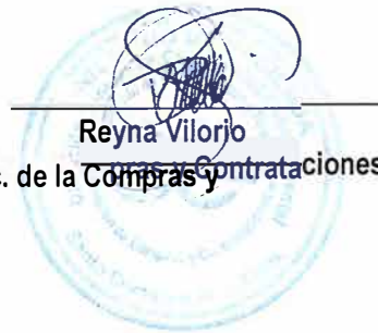
Reyna Vilorio Enc. de la Compras y Contrataciones