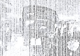
Participantes en la sesión de Domingo Savio.

Los participantes salieron desde las calles y avenidas de la ciudad. El rally que esta es una actividad que se realiza desde hace años. El evento que se realizó ayer fue un rally que se realizó ayer en el sitio de Domingo Savio.