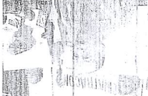
Participantes en la sesión de Domingo Savio.

Los participantes salieron desde las calles y avenidas de la ciudad. El rally que esta es una actividad que se realiza desde hace años. El evento que se realizó ayer fue un rally que se realizó ayer en el sitio de Domingo Savio.