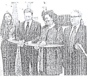
Autoridades durante corte de cinta.

ACTO. Con una inversión de 1.6 millones de pesos, la Procuraduría General de la República reinauguró la cárcel del palacio de Ciudad Nueva, la cual tiene una capacidad para albergar 200 internos.