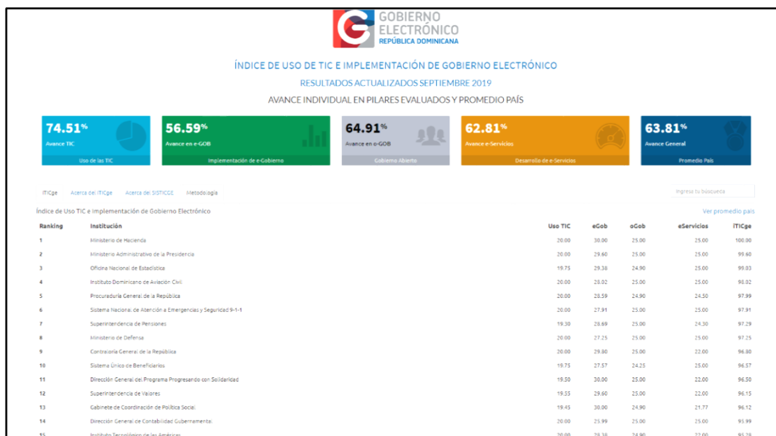
Ranking de Instituciones en la OPTIC

La OPTIC lleva el ranking de las instituciones por su cumplimiento con las directrices que se dictan en temas de Tecnologías y Gobierno Electrónico. En 2019, DIGECOG se posicionó entre las primeras 15 instituciones al alcanzar una puntuación de 95.99% .