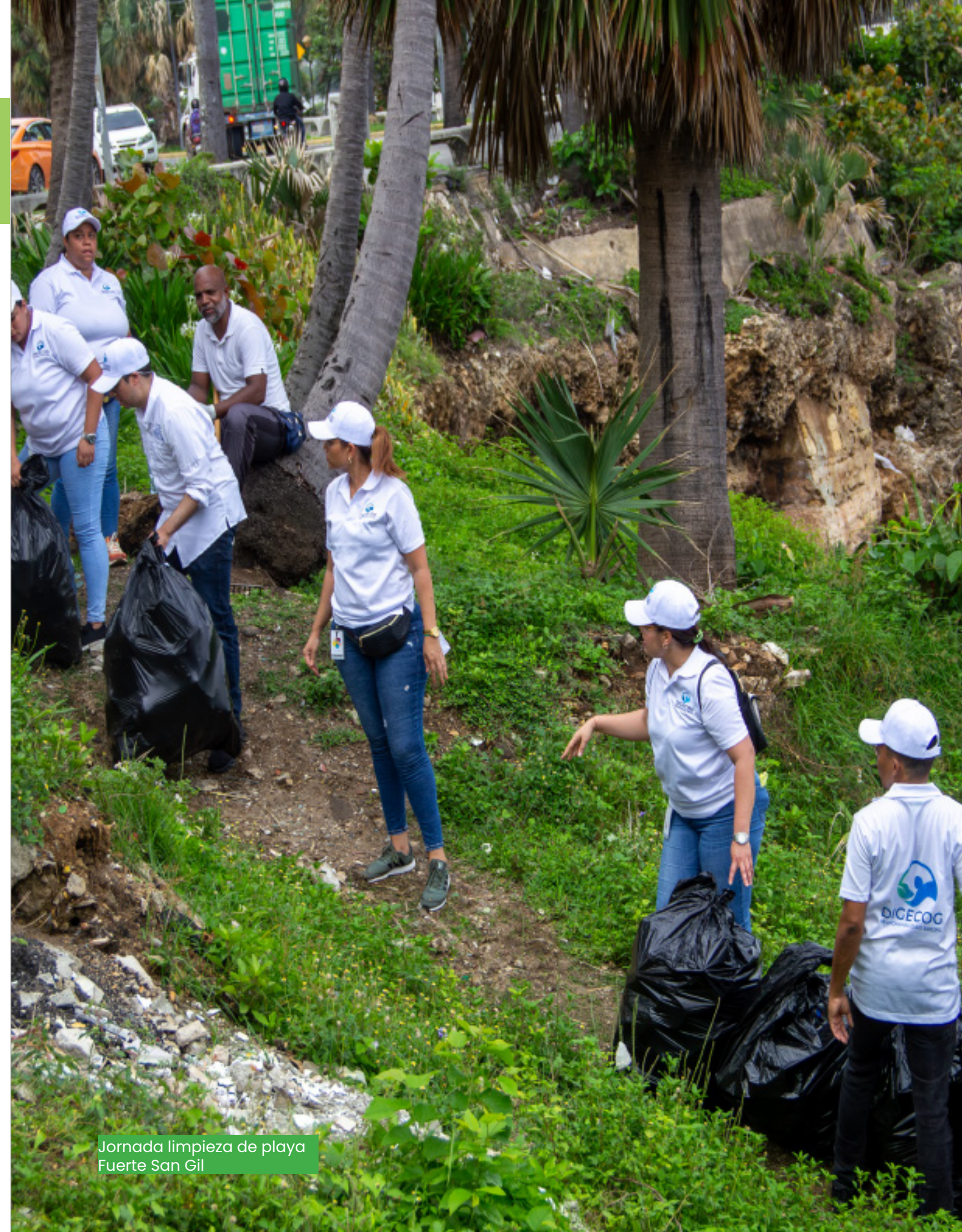
Jornada limpieza de playa Fuerte San Gil

Hoy creemos estar más cerca de como entidad responsable, de cumplir de forma significativa con los Objetivos de Desarrollo Sostenible (ODS).