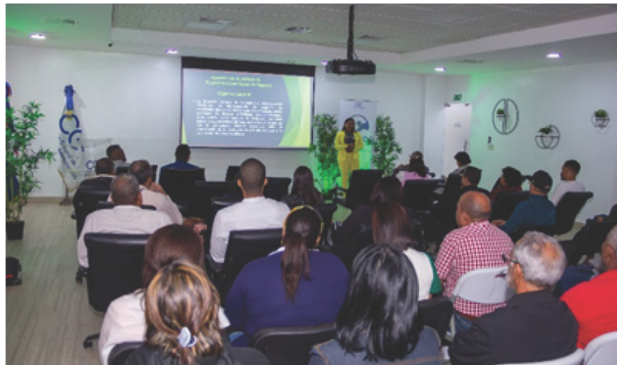
Viernes, 23 febrero 2024

Presentan programa Responsabilidad Social 2024